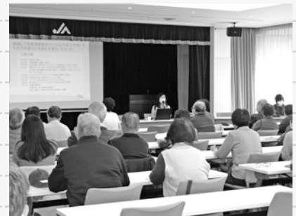
令和4年12月7日(水) JAレーク滋賀栗東総合センターにて

栗東市社会福祉協議会では、令和5年も皆さまに喜んでいただける講座、関心を寄せていただける講座を企画します。よりたくさんの方に参加していただけたらと思っています。今年もどうぞよろしくお願いいたします。