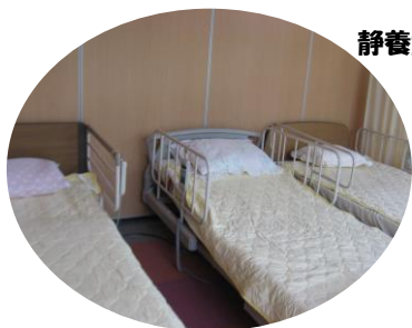
静養室・ベットです。