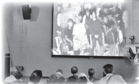
感動の「なごやか10周年のあゆみ」 DVD上映会