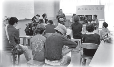
読み聞かせボランティア体験