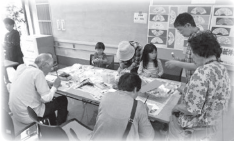
ボランティア体験の様様

10月11日(土)、ボランティアまつりと老人福祉センターなごやか10周年を記念し、「なごやかまつり ～人とひと♥絆でつなぐボランティア～」を開催しました。各ボランティアの工夫を凝らしたブースやステージでは、関係者のみならず来場された方々との交流の場ともなり、参加されたみなさんの絆がつながった一日となりました。