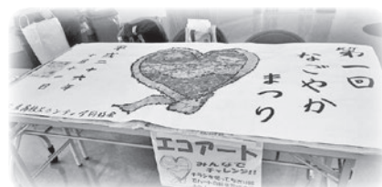
栗東高校ボランティア同好会デザインのシンボルマークを来場者の皆さまとチラシを使ってちぎり絵エコアートに仕上げました。