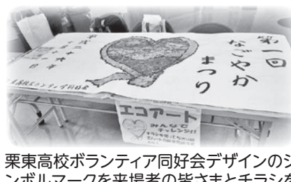
栗東高校ボランティア同好会デザインのシンボルマークを来場者の皆さまとチラシを使ってちぎり絵エコアートに仕上げました。