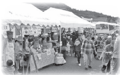
模擬店・フリマの様様