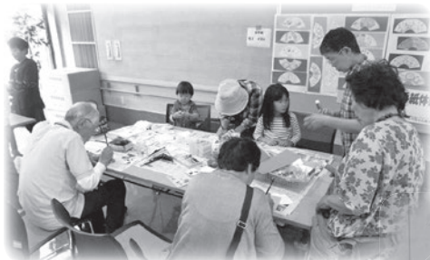
ボランティア体験の様様

10月11日(土)、ボランティアまつりと老人福祉センターなごやか10周年を記念し、「なごやかまつり ～人とひと♥絆でつなぐボランティア～」を開催しました。各ボランティアの工夫を凝らしたブースやステージでは、関係者のみならず来場された方々との交流の場ともなり、参加されたみなさんの絆がつながった一日となりました。