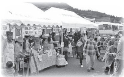
模擬店・フリマの様様