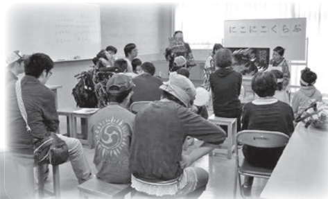
読み聞かせボランティア体験